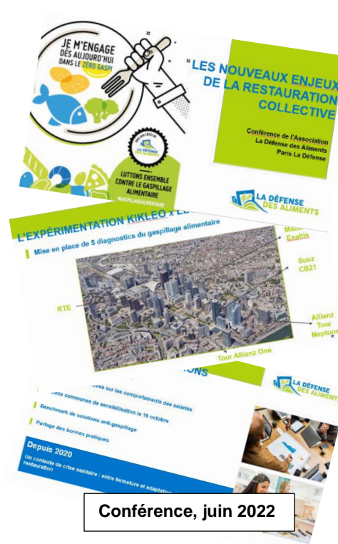
Conférence, juin 2022