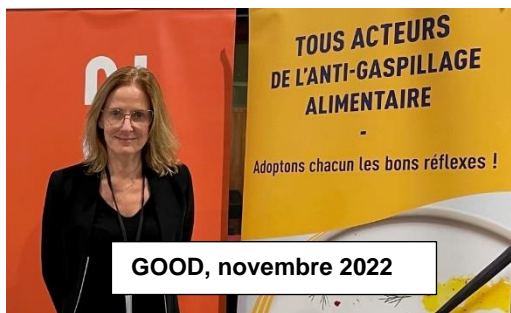
GOOD, novembre 2022